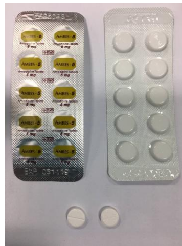
Amlodipine 5 mg (GPO)