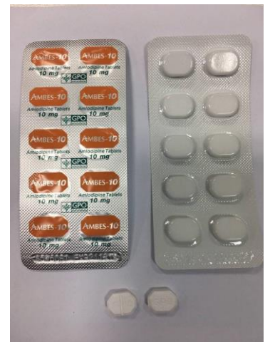
Amlodipine 10 mg (GPO)