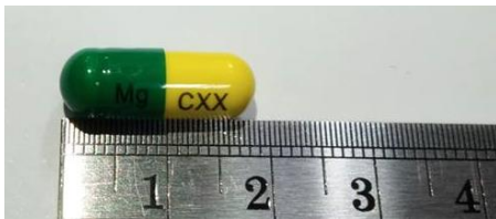
Magnesium oxide 140 mg oral (equivalent to 84.5 mg of elemental magnesium)