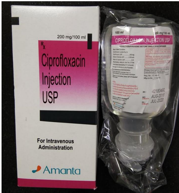
Ciprofloxacin injection 200mg/100ml